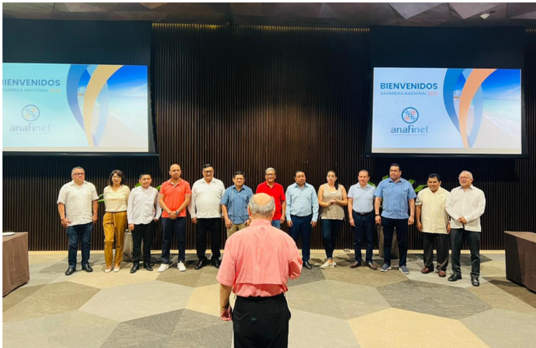
Toma de protesta a los representantes ANAFINET en todo el país