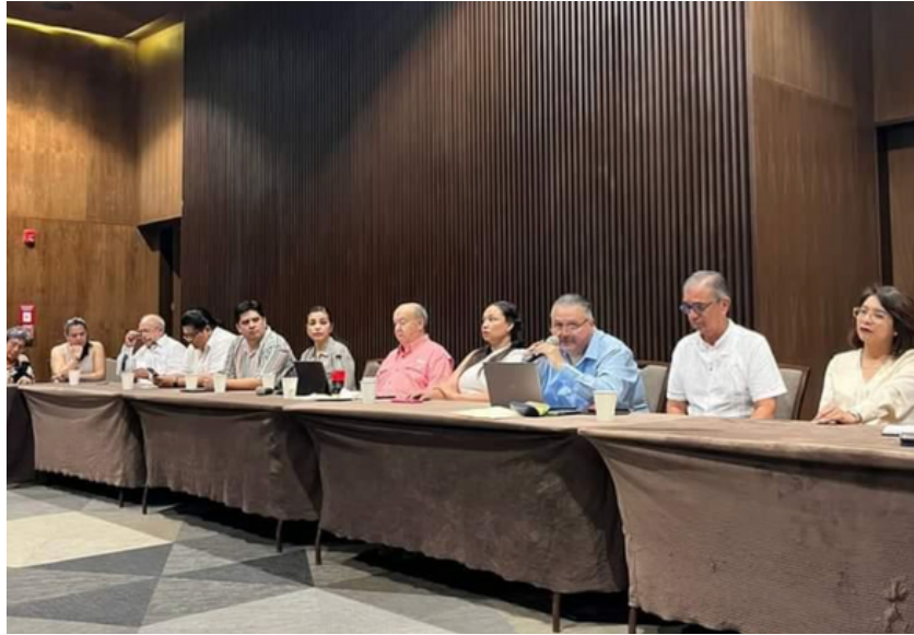
Presentación del informe financiero año 2023